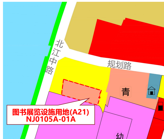
调整后用地示意图