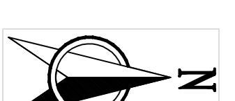
北江（滨江区段）河道管理范围划界成果总平面布置图